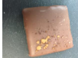
Bonbon au chocolat au lait à la cannelle