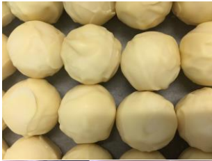
Truffe au chocolat blanc à la vanille de Madagascar