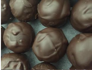
Truffe au chocolat grand cru du Venezuela