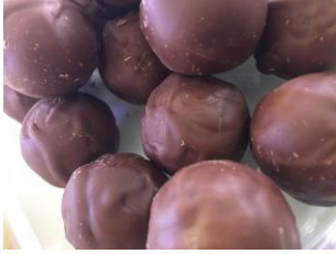
Truffe au chocolat au lait du Venezuela