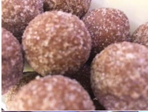
Truffe au caramel