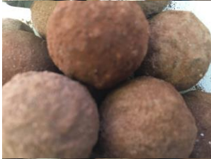
Truffe à la raisinée (vin cuit)