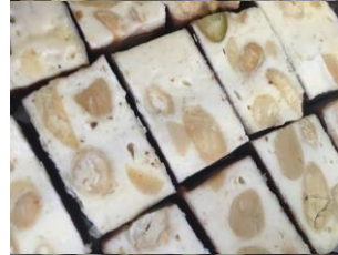
Nougat de Montélimar enrobé de chocolat noir