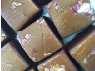
Caramel à la rose, enrobé de chocolat noir