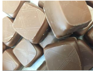
Bonbon au chocolat à la framboise et au caramel à la fleur de sel