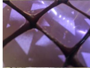
Bonbon au chocolat grand cru d'Equateur au café et croquant à la noix de pécan