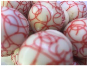
Truffe au champagne