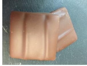
Bonbon au chocolat au lait à la fève de tonka