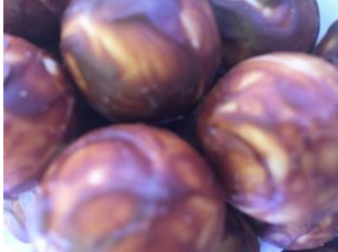
Truffe à l'absinthe