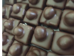
Praliné aux noisettes