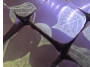
Bonbon au chocolat noir grand cru de Tanzanie et massepain à la pistache