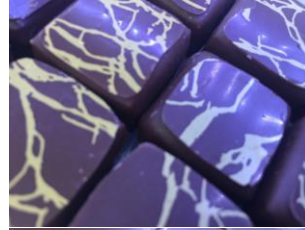
Bonbon au chocolat au lait grand cru du Venezuela au citron et croquant aux arachides