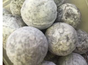
Truffe au Grand-Marnier