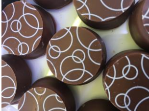
Bonbon au chocolat au lait au nougat croquant