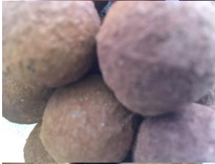
Truffe à la fève de tonka